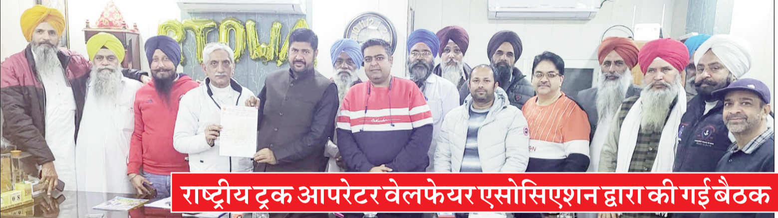
राष्ट्रीय ट्रक आपरेटर वेलफेयर एसोसिएशन द्वारा की गई बैठक

किसानों के विरोध प्रदर्शन को देखते हुए दिल्ली के सिंधु बॉर्डर पर सुरक्षा-व्यवस्था के इंतजाम कड़े कर दिए गए हैं जिसके चलते जीटी करनाल रोड पर ट्रैफिक जाम लग रहा है। रोड पर वाहनों की रफ्तार धीमी हो गई है। आगामी 13 फरवरी को होने वाले किसान आंदोलन दिल्ली चलो की सुगबुगाहट के बीच दिल्ली पुलिस ने सिंधु बॉर्डर पर चौकसी बढ़ा दी है। नई दिल्ली। किसानों के विरोध प्रदर्शन को देखते हुए दिल्ली के सिंधु बॉर्डर पर सुरक्षा-व्यवस्था के इंतजाम कड़े कर दिए गए हैं, जिसके चलते जीटी करनाल रोड पर ट्रैफिक जाम लग रहा है। रोड पर वाहनों की रफ्तार धीमी हो गई है। रात होने की वजह से वाहन धीरे-धीरे चल रहे हैं। आगामी 13 फरवरी को होने वाले किसान आंदोलन दिल्ली चलो की सुगबुगाहट के बीच दिल्ली पुलिस ने सिंधु बॉर्डर पर चौकसी बढ़ा दी है। रविवार की सुबह से ही सिंधु पर भारी मात्रा में कंट्रीले तार, मिट्टी से भरी बोरियां, सोमेट व लोहे के बैरिकेड्स व अन्य सामान लाए गए। आठ से अधिक क्रेन व जेसीबी भी बॉर्डर पर मौजूद हैं। कई बड़े कंटेनर भी लाए जा रहे हैं। जरूरत पड़ने पर इन कंटेनर को बॉर्डर पर खड़े करने की भी तैयारी चल रही है।